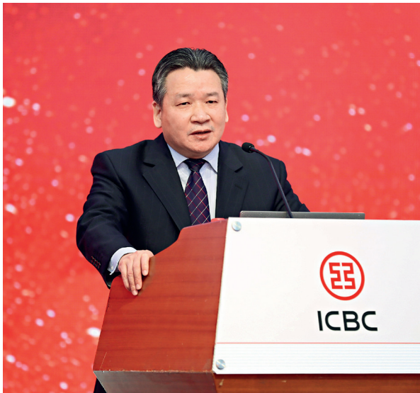
何德旭，社科院财经战略研究院院长。